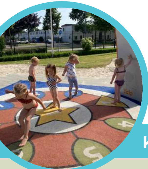
In de speeltuin in Helmond