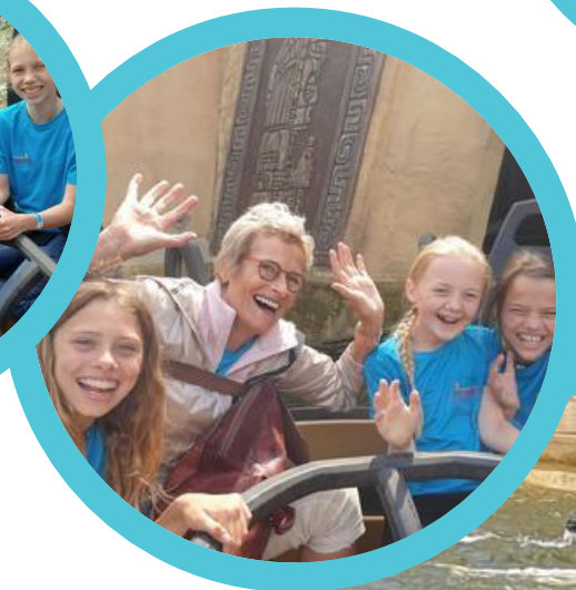
In de Efteling