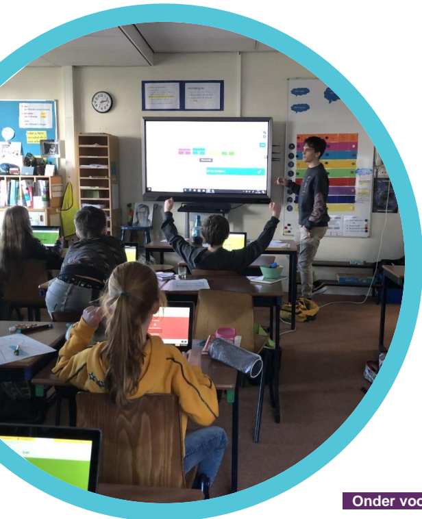
Een quiz met een stagiaire tijdens de noodopvang

Vandaag ontvangt u via onze stichting GOO een informatiebrief over het vervolg van de lockdown. Er wordt nog gekeken naar de geplande rapporten en bijbehorende 10 minutengesprekken; zo goed als zeker schuiven die iets op. U hoort hier nog meer van wanneer dit definitief is. Het adviestraject voortgezet onderwijs voor de groepen 8 blijft wel volgens planning lopen.